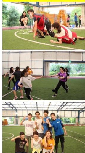
綱引きの掛け声は「わっしょい! ?」