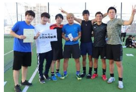
ドーミー小田急相模原