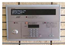
全ての寮がオートロック

オートロックや防犯カメラを設置して、セキュリティは万全。寮長夫妻が常駐なので、まさかの時も安心です。